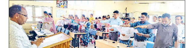
फतेहाबाद। जनगणना कार्य के लिए एन्यूमेरेटर और सुपरवाइजर के लिए आयोजित प्रशिक्षण कार्यक्रम में जानकारी देते हुए मास्टर ट्रेनर्स।