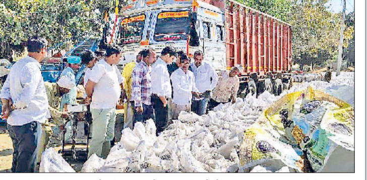
सिरसा। देसूजोधा फसल खरीद केंद्र का निरीक्षण करते एडीसी।