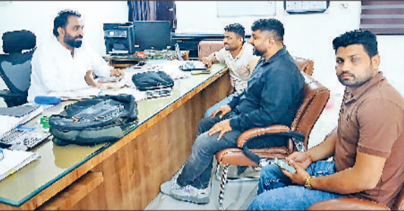
रतिया। सीवरेज लाइन को लेकर चर्चा करते अधिकारी।