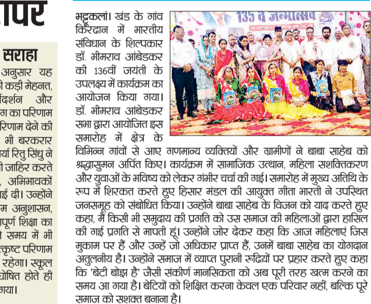
सिरसा। मल्लेवाला में आयोजित कार्यक्रम में पहुंचे श्रद्धालु।