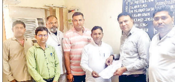
फतेहाबाद। नए जीएम का स्वागत कर उन्हें मांग पत्र सौंपते रोडवेज यूनियन के पदाधिकारी।

हुई हैं, जिससे रोडवेज कर्मियों में भारी रोष है।