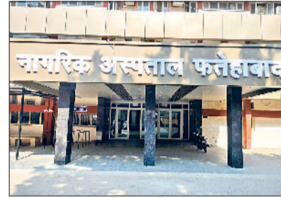
फतेहाबाद। नागरिक अस्पताल व गर्मी के चलते दोपहर को सुनसान पड़ा बाजार।