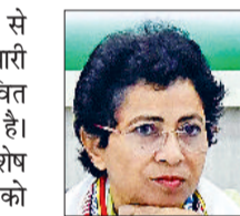
सांसद कुमारी सैलजा।

अधिकारियों और सुबह से ही रेस्ट हाउस में जुटे कांग्रेस कार्यकर्ताओं को मायूस लौटना पड़ा। अब प्रशासन द्वारा दिशा कमेटी की बैठक के लिए नया शेड्यूल जारी किया जाएगा।