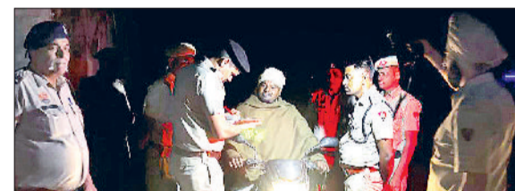
सिरसा। नाइट डोमिनेशन अभियान के तहत वाहन चालकों की जांच करते हुए।